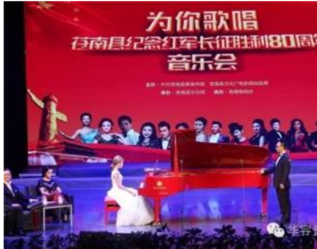
图6.2-13 苍南县纪念红军长征胜利80周年音乐会