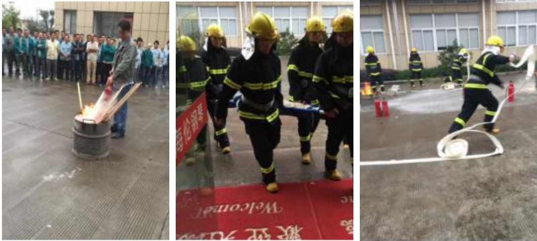
图 6.2-1 演习图

为了确保工作场所发生紧急状态和危险情况时，把人身危害及财产损失降到最低，公司在相关场所配置了消防设施和应急照明灯，建筑设计上考虑了抗台防台要求，同时公司还组织成立了抗台风领导小组。公司制定了包括消防、台风等多个应急预案，如消防应急预案、抗台应急预案、触电应急预案、食物中毒紧急应变预案、传染病应急预案，并不定期组织模拟演练。近年来，公司组织了多次防火、抗台应急模拟演练（图 6.2-1）。