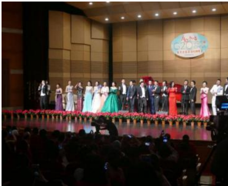
图6.2-14 蔡大生等歌唱家携手海伦为G20峰会献歌杭州

公司举办、赞助各地多种多样的音乐比赛和考级比赛，让音乐爱好者能集聚一堂，交流音乐心得，促进音乐教育事业的发展。公司投入 50 万元与厦门大学