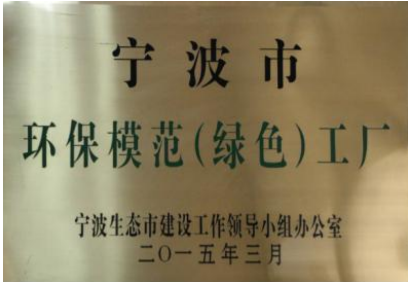
图 6. 2-4 宁波市环保模范（绿色）工厂