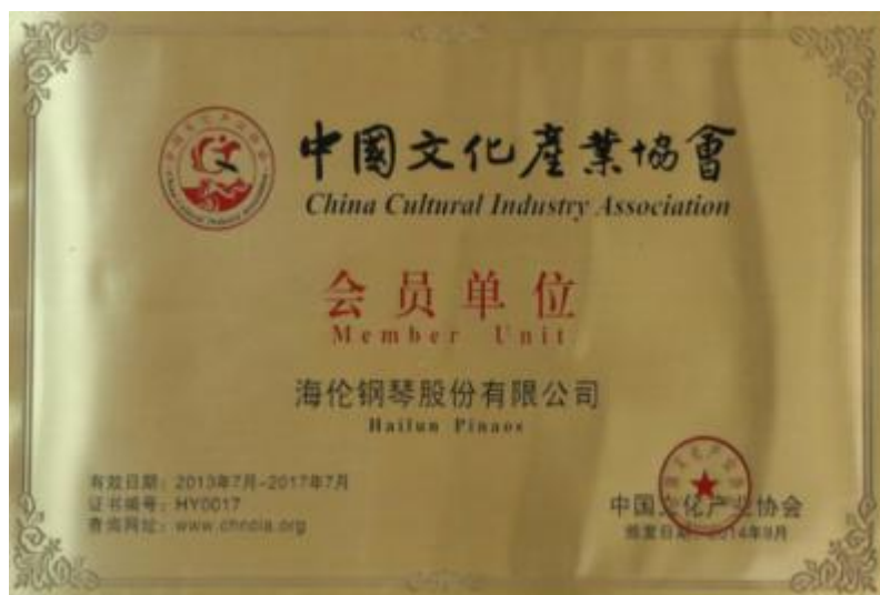
图6. 2-16 中国文化产业协会会员单位