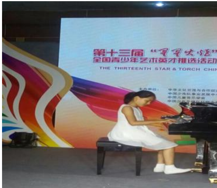
图6.2-15 第十三届“星星火炬”全国青少年英才钢琴比赛

合作举办“海伦杯”钢琴比赛，让音乐爱好者和学习者相聚厦门，在比赛的同时畅谈音乐。公司每年赞助各地琴行和地方文化部门举办钢琴比赛，推动当地音乐教育水平的提升。