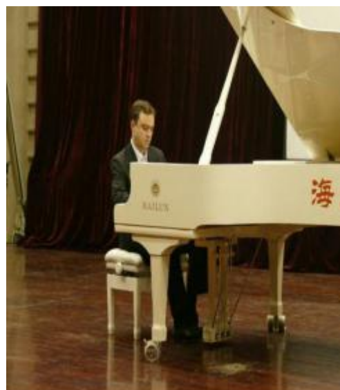
图6.2-10 维也纳钢琴家弗拉基米尔·卡林全国巡演活动-青岛站