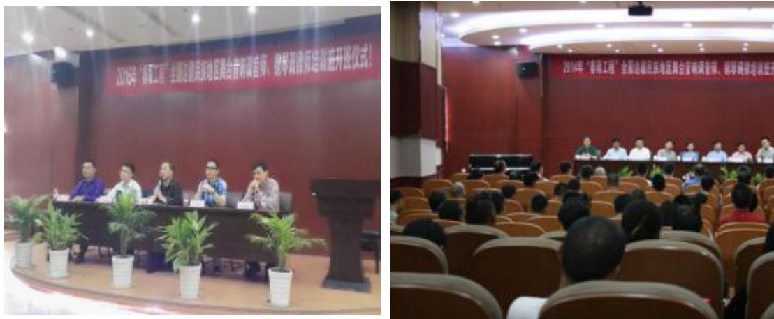
图6.2-8 边疆钢琴调律培训班开班仪式

公司与宁波职业技术学院合作，开设钢琴制造调律专业，公司捐赠教学设备和教学用具。作为学校的实践基地，公司每年都会接受学校学生进行技能实践活动，积累的实践操作经验。公司每年开设“边疆钢琴调律师班”，对西北边疆的钢琴调律师提供免费食宿，培养边疆钢琴人才。