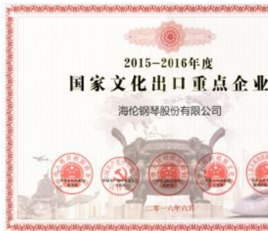
图6.2-5 国家文化出口重点企业

公司重视产品质量，被评为国家文化出口重点企业（图6. 2-5）；钢琴被浙江省质量技术监督局评定为浙江名牌产品（图6. 2-6）。公司诚信守法经营，历年来无一例违规经营事件发生。公司积极依法纳税，纳税总额在企业所在区的排名中处在前列。近三年公司道德行为测量结果如表6. 2-8所示。