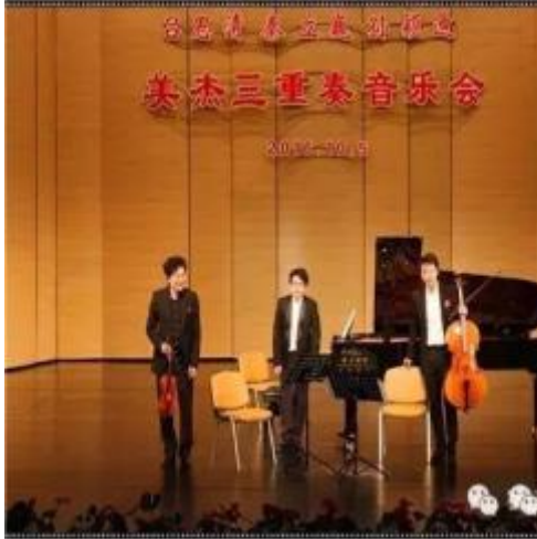
图6.2-12 宿迁美杰三重奏音乐会

除了邀请大师举办钢琴音乐会，公司赞助全国各地经销商协办各种演唱会音乐会，提供表演钢琴赞助，场地费用补助等等，使音乐活动举办的更加丰富多彩，不但陶冶了各地人民的音乐情操，而且推动了当地文化活动的持续开展。